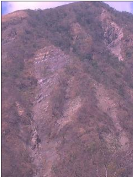
Foto 11- Inestabilidad 16