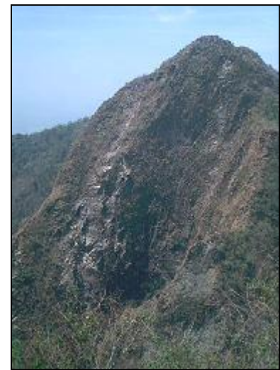
Fotos 12, 13, 14, 15- Cresta entre la quebrada La Quebradona y California (arriba izq), grieta en cresta a detalle (arriba derch), Inestabilidad en cabecera (abajo izq), inestabilidad 18 (abajo derch)