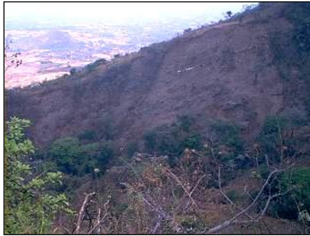
Foto 1, 2- Zona de erosión en ladera norte (izq), inestabilidades 8, 9, 10, 11 en la ladera sur (derch).