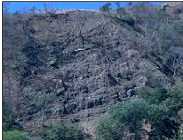
Foto 3, 4- Inestabilidades en la ladera sur 8 y 9 (izq), 10 (derch)