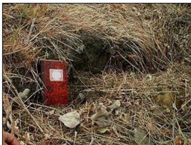
Fotos 7, 8- Grietas en las cabeceras de las inestabilidades 11 .(izq), 12 (derch)