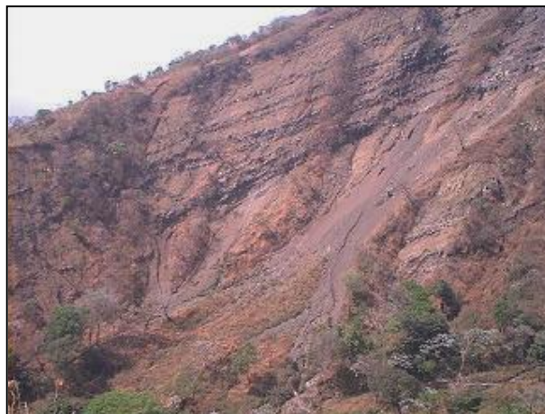
Foto 5, 6- Ladra sur (izq), inestabilidades 11,12,13 y 14.(derch)