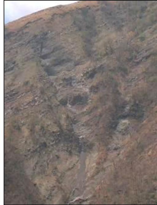
Foto 9, 10- inestabilidades 15 y 16 .(izq), inestabilidad 15 a detalle (derch)